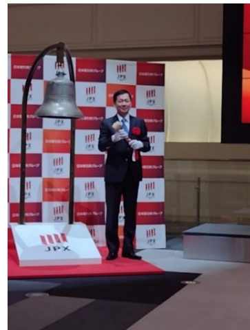
(撮影のためマスクを外しています)

人数制限があり、役員5名のみでの参加、かつ無観客というささやかなものではありましたが、五穀豊穡を祈る5回の鐘の音に、1年前の苦労と感動を思い出しました。